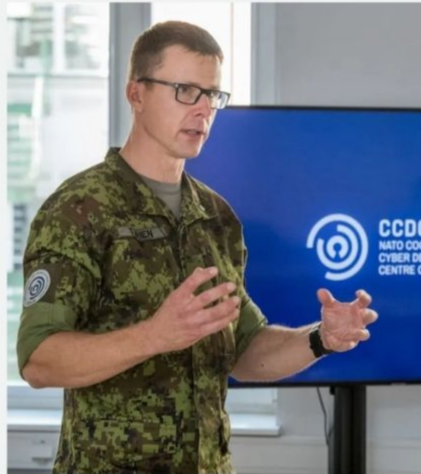
ÜLIKOOEALINE NOORMEES, KES LÄHEB KAITSEVÄKKE TEENIMA