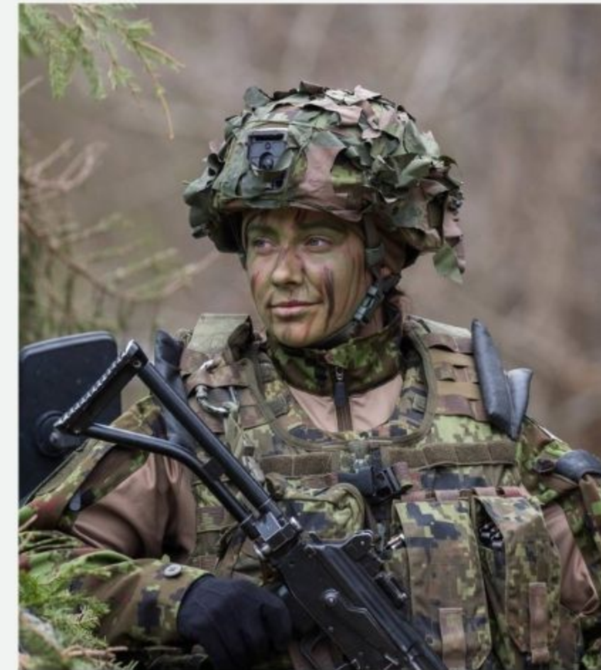
TÜDRUK, KES OTSUSTAB VABATAHTLIKULT MINNA KAITSEVÄKKE TEENIMA.